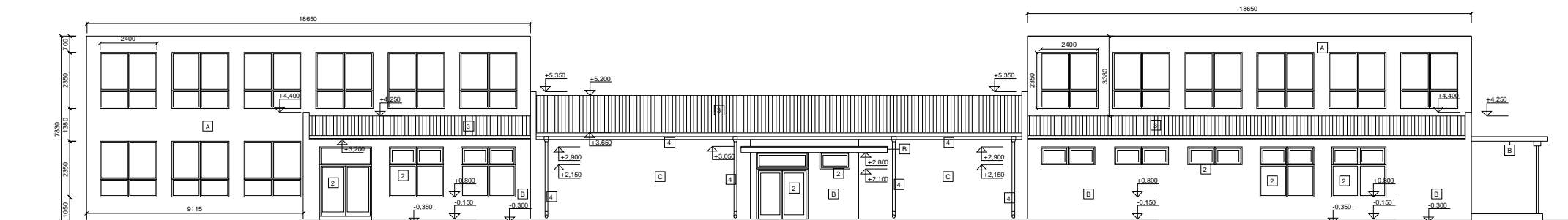
PAVILÓN A,B - pohľad severovýchodný